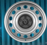
16" Jant Kapakları