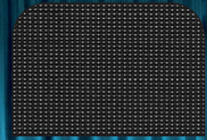
Meltem Kumaş Döşeme 43FT-Siyah