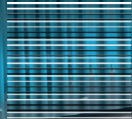
17" Jant Kapakları